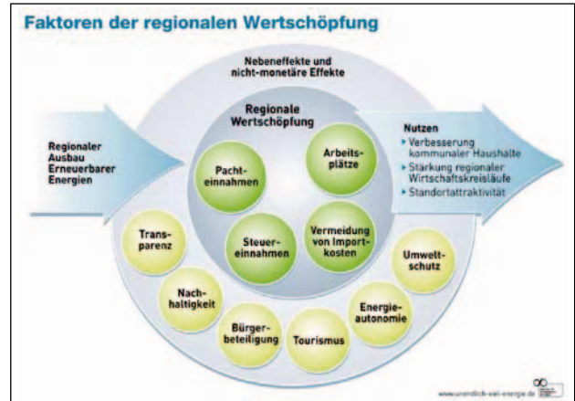
Abb.2: Faktoren der regionalen Wertschöpfung

Damit die kommunale Energiewende zu einem Erfolg für Gemeinden wird, ist die Wahl eines vertrauenswürdigen Projektentwicklers entscheidend. Nur so ist gewährleistet, dass bei Projekten wie Aufdach-solaranlagen oder PV-Parks Komponenten