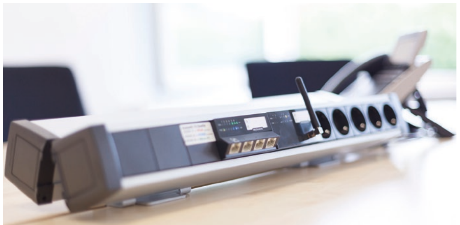
Abb. 4: Die Schaltzentrale – MICROSENS Micro-Switch samt Micro Acces Point

Dezentrale Netzwerkarchitekturen ermöglichen es den Anwendern, ihre Arbeitsplatzumgebung individuell zu gestalten und ganz ihren persönlichen Anforderungen anzupassen. Das gilt für Heizung und Klimatisierung und es gilt erst recht für die Beleuchtung. Lichtstärke und Lichtfarbe haben einen direkten Einfluss auf das Wohlbefinden der Mitarbeiter, was nachgewiesenermaßen zu höherer Produktivität und geringeren Fehlraten führt. Mit individuellen, dezentralen