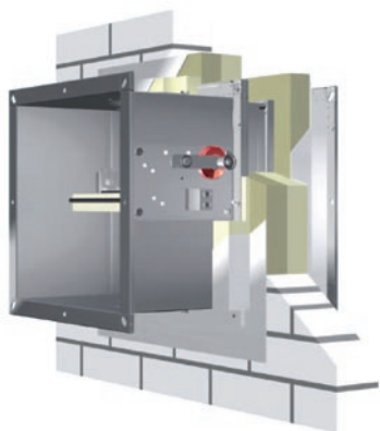
Abb.3: TROX Brandschutzklappen der Serien FK-EU und FKRS-EU sind in Verbindung mit der Weischottabschottung des Spalts zwischen Wandaubung und Brandschutzklappe nach EN 1366-2 geprüft und nach EN 13501-3 klassifiziert bis EI 120 S.

Einbaualternativen wie der Weischott lassen dem Planer sämtliche Freiheiten, sich kreativ zu entfalten. Während