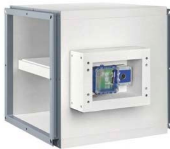
Abb.2: TROX Brandschutzklappen mit Federückenantrieb der Serien FK-EU sind nach EN 1366-2 geprüft und nach EN 13501-3 klassifiziert bis EI 120 S.

Abb.1: TROX Entrauchungsklappen Serie EK-EU mit Lüftungsfunktion zur Abführung von Rauch über Entrauchungsanlagen mit maschinellen Rauchabzugsgeräten oder zur Nachströmung, in Verbindung mit der vollständigen Leistungserklärung, in der alle Einbausituationen dargestellt werden.