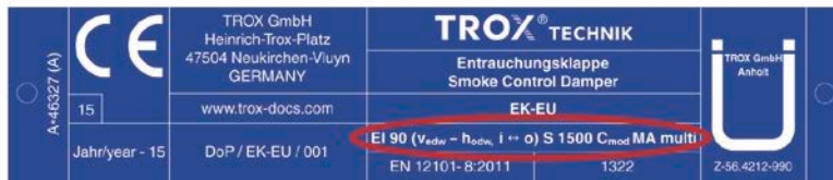
Abb.6: Typenschild und Erläuterung der Klassifizierungsbestandteile für eine Entrauchungsklappe