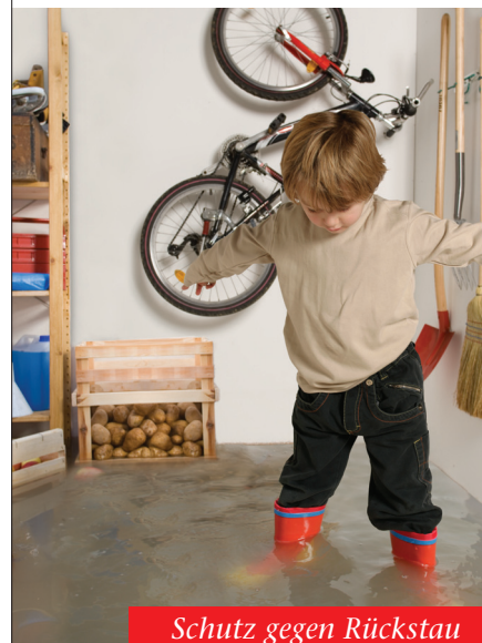
Schutz gegen Rückstau