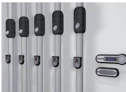
Installationsaufbau LegioTherm® Zirkulationsregler

In Zeiten steigender Hygieneanforderungen kommt dem Legionellenschutz eine besondere Wichtigkeit zu. Das komfortable Wohnen mit Kalt- und Warmwasserverteilung im ganzen Haus wird bei Jung und Alt immer mehr zur Selbstverständlichkeit. Nur zeitweise benutzte Wohnräume mit sanitären Installationen führen zu langen Wasserstagnationszeiten. Kommen weitere ungünstige Gegebenheiten