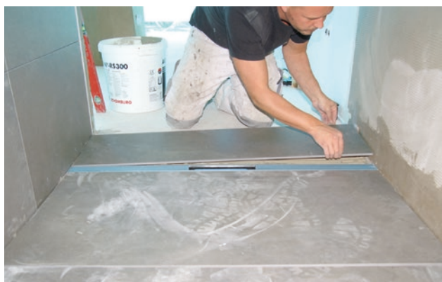
Abb. 2: Die Abdichtung des Bodenablaufs im Verbund ist seit Jahren gängige und bewährte Praxis. Dem trägt jetzt auch die neue DIN 18534 Rechnung.

In Reihenduschen von Sport- oder Gewerbestätten hingegen gehören neben dem Boden sogar die wasserbenetzten