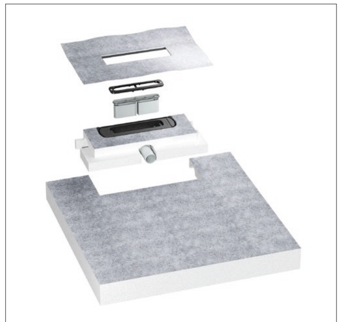
Abb. 6: Die normativ wie technisch in jeder Hinsicht abgesicherte Komplettlösung für bodengleiche Duschen sind solche Duschboards (hier: Duschelement „DallFlex“), bei denen werksseitig das notwendige Gefälle schon vorgeformt ist.