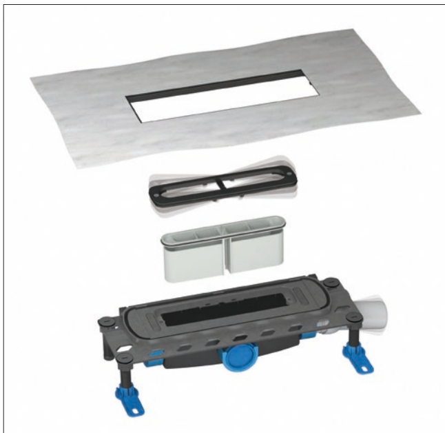
Abb. 5: DallFlex-System verbindet durch die einclipbare, ringsum durchweg mehr als 100 mm breite Dichtmanschette ein hohes Maß an Verarbeitungssicherheit mit der eindeutigen Trennung der Gewerke Sanitär und Estrich bzw. Fliesenleger.

Wie bei den auf Estrich in die AIV eingebundenen bodengleichen Abläufen, hat die Abdichtung der Duschboards analog zu den Wassereinwirkungsklassen ebenfalls mit rissüberbrückenden, flexiblen Dichtmanschetten zu erfolgen. Die Installation des Duschboards ist nach der neuen DIN 18534 dadurch um ein Vielfaches einfacher als die Montage einer konven-